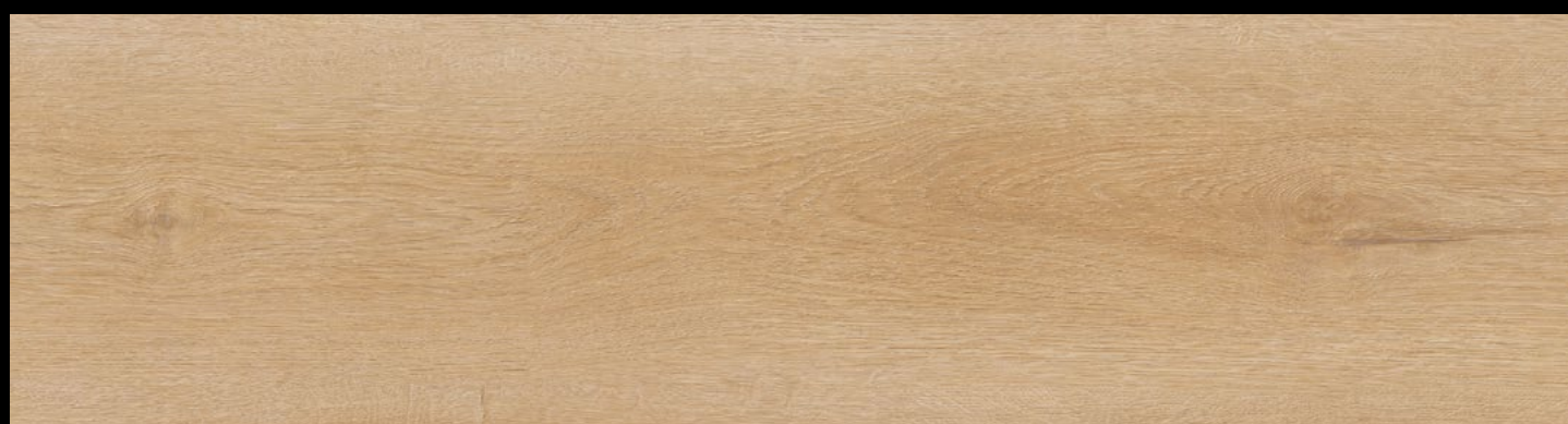
EG 6074 - ROVERE ALPE