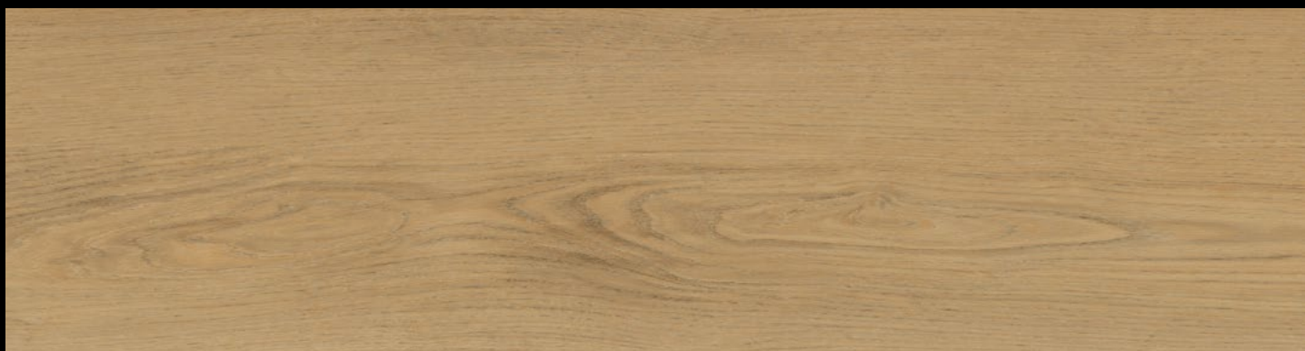
EG 6072 - ROVERE CALEDONIA