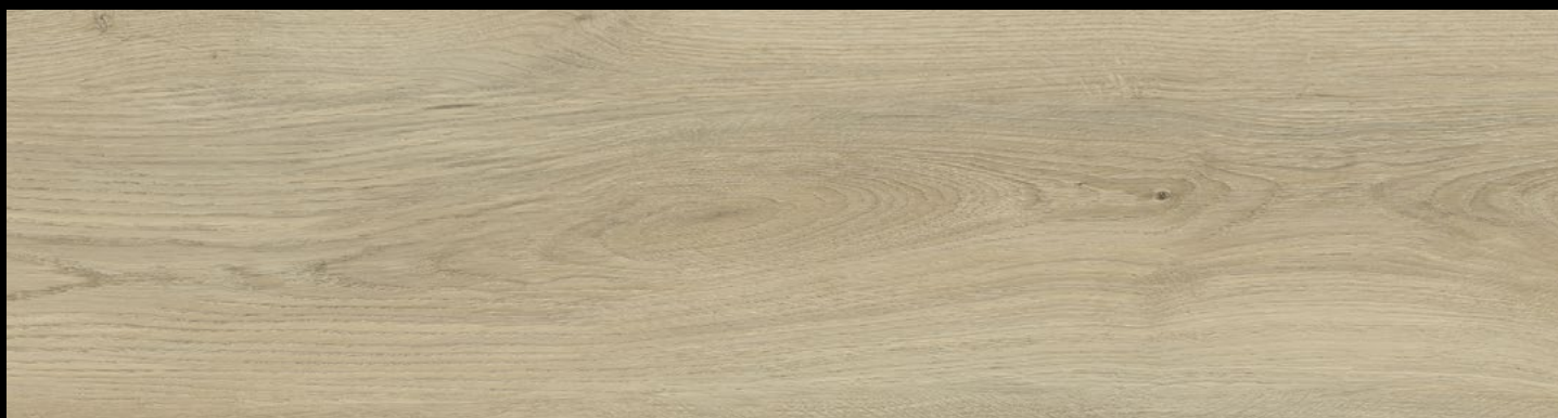
EG 6070 - ROVERE MONTANA