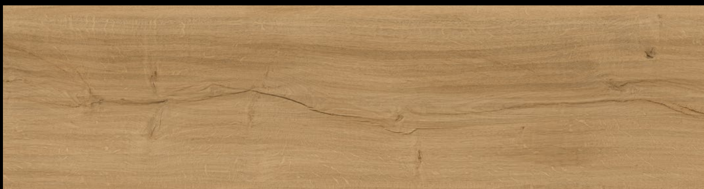
EG 6073 - ROVERE BAVIERA