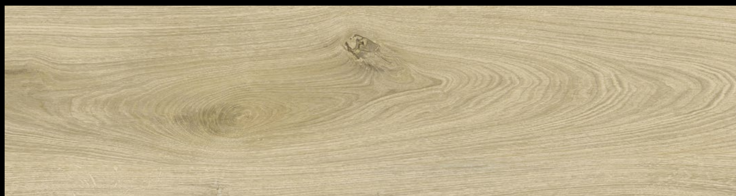
EG 6075 - ROVERE BORGOGNA