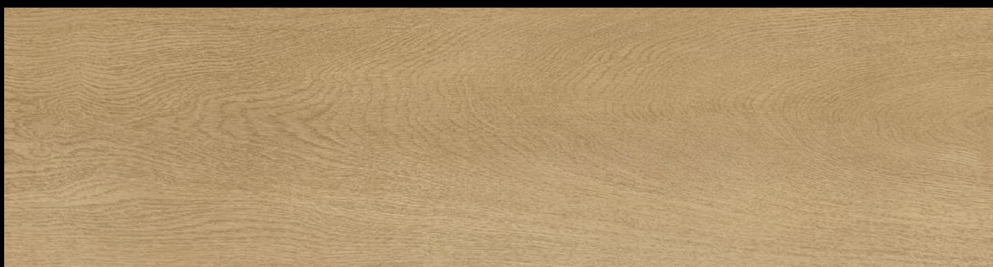
EG 6071 - ROVERE FONTAINES (decoro in copertina / design on cover)